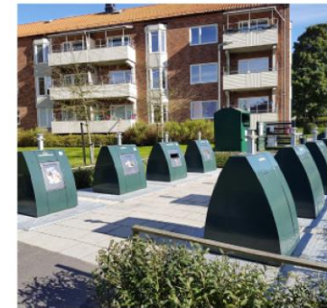
Bottentömmande behållare.